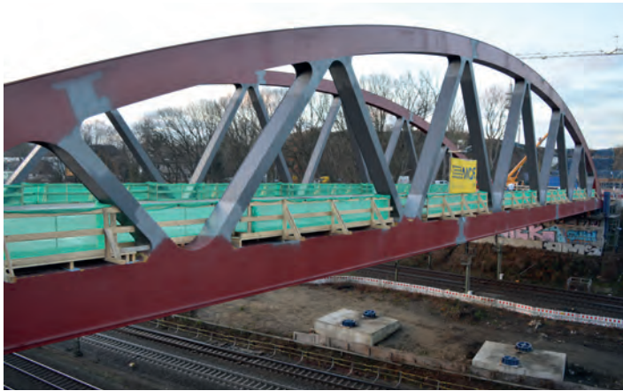
Noch im Januar gehen die Arbeiten an der neuen Brücke weiter.

Neubau der Buselohbrücke liegt im Zeitplan – Abriss-Varianten des alten Bauwerks werden diskutiert