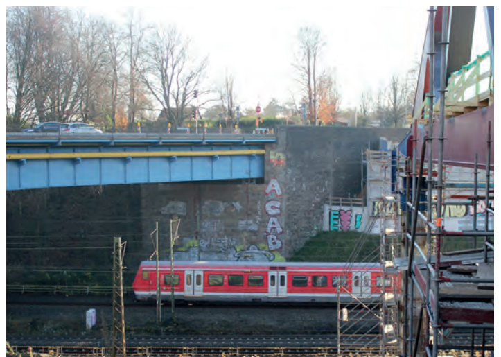
Die alte Buselohbrücke wird abgerissen.