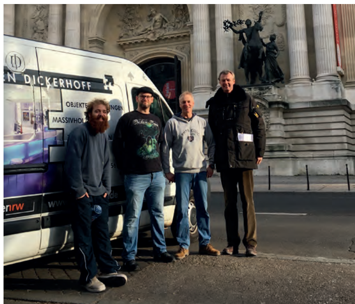
Das Team von Dickerhoff vor dem „Grand Palais“ in Paris.

Von der Altenbochumer Straße an die Champs-Élysées: Die Werkstätten Dickerhoff haben einen neuen Spezialauftrag erhalten – nur einen Steinwurf vom Pariser Prachtboulevard entfernt. Gerufen hat die Deutsche Botschaft.