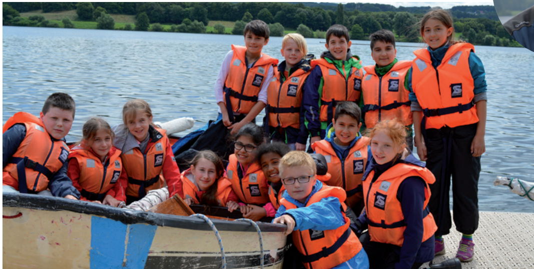
Schüler der Vels-Heide-Schule: Segelwoche am Kemnader Stausee.