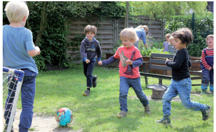
Bei jedem Wetter zieht es die Kinder nach draußen.