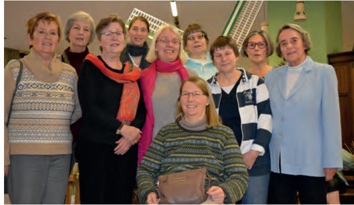
Der Besuchsdienstkreis der evangelischen Kirchengemeinde.

Dieses Engagement ist gar nicht hoch genug zu bewerten: Seit 13 Jahren kümmern sich die Mitglieder des Besuchsdienstkreises der evangelischen Kirchengemeinde Altenbochum-Laer um Menschen, die fast niemanden mehr haben. Doch es können längst nicht alle Besuchswünsche erfüllt werden. Deshalb werden weitere Mitarbeiter gesucht.