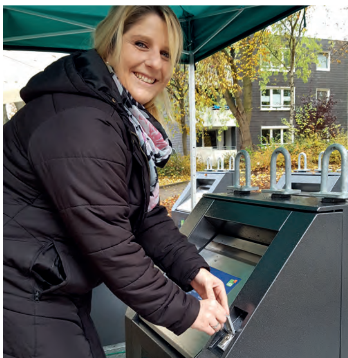
Müllentsorgung leicht gemacht: Schlüssel rein, Klappe auf.

von 24 Kubikmetern allerdings gleich um ein Vielfaches größer. Sie ist für insgesamt 61 Wohneinheiten ausgelegt. Die Befüllung ist einfach. Jeder Bewohner hat einen Schlüssel erhalten, mit dem sich die Klappen der Einwurf-Behälter problemlos öffnen lassen. Wegen ihrer geringen Einwurfschächte ist die neue Anlage auch gleich kinder- und behindertengerecht. „Der erste Eindruck ist wunderbar“, fand auch Bürgermeisterin Erika Stahl bei der Einweihung. „Das kann ein Vorzeigeprojekt für Bochum werden.“ Der besondere Vorteil: Jeder Bewohner hat die zentral angelegte Anlage im Blick, jeder kann darauf achten. „Früher hat man die Container oft irgendwo in die Ecke gestellt“, sagt Christian Kley, technischer Geschäftsführer des USB. Bei einer derart sauberen Lösung sei dies nun aber nicht mehr nötig.