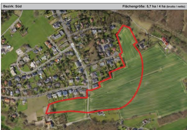
ASB 5-1: Baumhofstraße