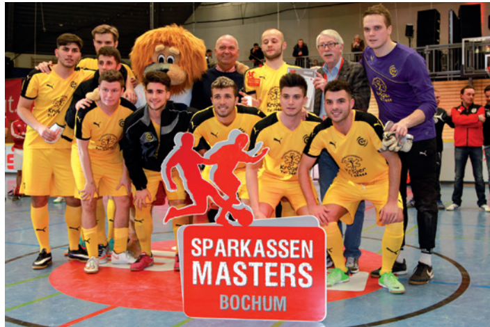
Will ihren Erfolg aus dem vergangenen Jahr wiederholen: Die CSV-Reserve.

Tags darauf spielen die ersten Mannschaften am gleichen Ort (ab 13 Uhr) die Teilnehmer der Endrunde aus. Der CSV Linden