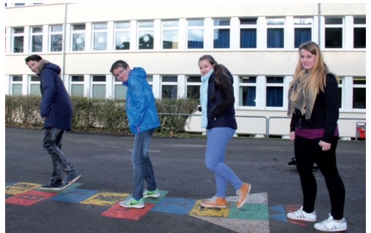
Ein Teil der Schulhof-AG.

melt. Die Ideen für die Auswahl der Geräte entwickelte die von Dreier geleitete Schulhof-AG. Sieben Schüler engagieren sich freiwillig dafür, dass auf dem Schulhof für alle etwas geboten