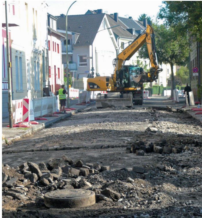
Aktuell machen die Bagger auf der Lindener Straße ihre Arbeit.