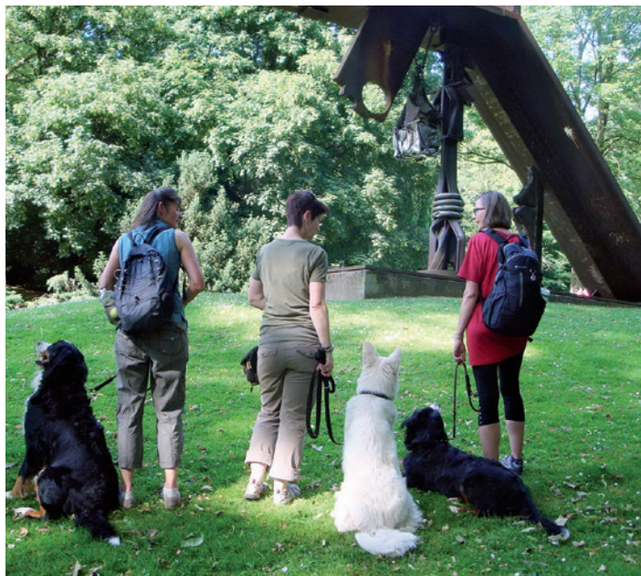
Ungewöhnlicher Spaziergang mit Hund zur Kunst.

„Natürlich ist es nicht der Sinn, dem Hund Kunstwerke unter freiem Himmel erklären zu wollen“, sagt Posca. „Es geht hierbei vielmehr um Wahrnehmung.“ Die Hundefachfrau, die selbst zwei Berner Sennenhunde ihr Eigen nennt, weiß, wovon sie redet. „Da der Hund die menschliche Sprache natürlich nicht spricht, muss ich ihn genau beobachten, um ihn richtig zu verstehen“, erläutert Posca, und fügt hinzu: „Und genauso kann ich auch ein abstraktes Kunstwerk erst verstehen, wenn ich es genau betrachte.“ Denn kommt es im Alltag zu Problemen mit dem geliebten Vierbeiner, dann liegt das häufig schlichtweg an Missverständnissen zwischen Mensch