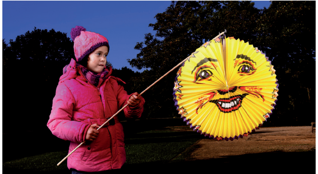
Rund um den 11. November ziehen die Kinder beim Lichterfest durch die Straßen.

Ev. Kita, Gaußstraße 73: Nach einer Runde um die Kita, samt Ross und Reiter, wird bei Posaunenspiel eine kleine Feuerstelle entzündet.