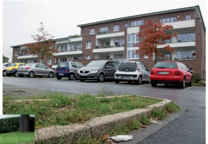
Müll am Denkmal (li.) und am Geldmacher-Haus.