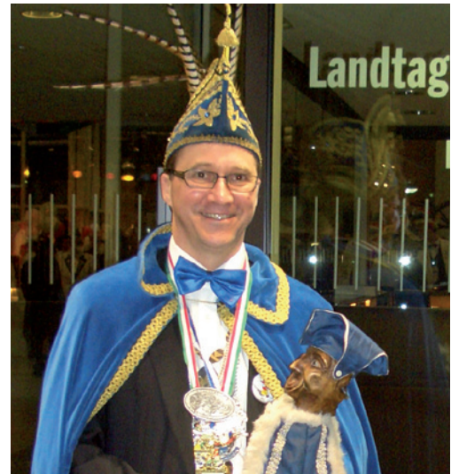
Prinz Stefan Wins am Düsseldorfer Landtag.

Einfach den Spaß mitnehmen, die Mannschaft motivieren und mit dem Herzen bei der Sache sein. Ich bin schon gespannt, wer es wird und wünsche dem Nachfolger oder der Nachfolgerin viel Glück.