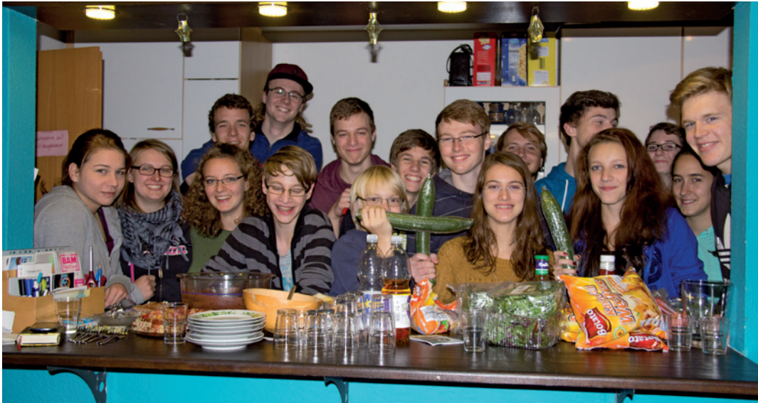
Die Teens under the cross beim veganen Kochduell.

Die Arche-Jugendgruppe „Teens under the cross“ zwischen Spaß und Tiefsinn