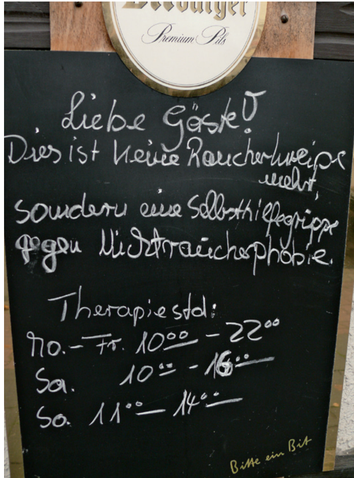
Das Schild vor der „Bauernstube“.

Am 1. November war es genau ein halbes Jahr her: Das viel diskutierte Nichtraucherschutzgesetz der Landesregierung wurde auf den Weg gebracht und verbannt seitdem tausende Liebhaber des blauen Dunstes samt Rauchwerk vor die Kneiptür. Bei einem Verstoß drohen Wirten und Gästen empfindliche Strafen. Ein halbes Jahr danach hat sich „Vor-Ort“ in den Kneipen des Stadtteils umgesehen und umgehört. „Liebe Gäste, dies ist keine Raucherkneipe mehr, sondern eine Selbsthilfegruppe gegen Nichtrauchersphobie. Therapiestd: Mo.-Fr. 10 00 - 22 00 Sa. 10 00 - 16 00 So. 11 00 - 14 00 Bitte ein Bit