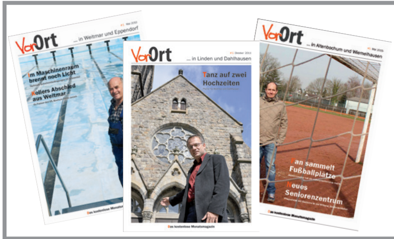
Die jeweils allerersten VorOrt-Ausgaben aus den Stadtteilen.

Die Autobahn 448 hieß NS VII bzw. Oviendorf, die Schülerzahlen gingen stetig nach oben und in der Brantrop sowie der Dorfschule Eppendorf erfüllte vormittags noch Kinderlachen den Schulhof. Sonntagmorgens bimmelte regelmäßig die Glocke der Kirche Vierzehnheiligen, im Schloßpark entstand gerade aus den Ruinen ein neues Museum, das heute Weltruf hat, die Fachwerkhäuser in Eppendorf-Mitte galten zwar als „nicht hübsch“, aber als unantastbar und Blumen