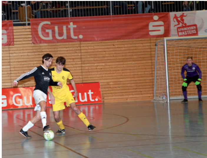
Packende Zweikämpfe beim Hallen-Masters.